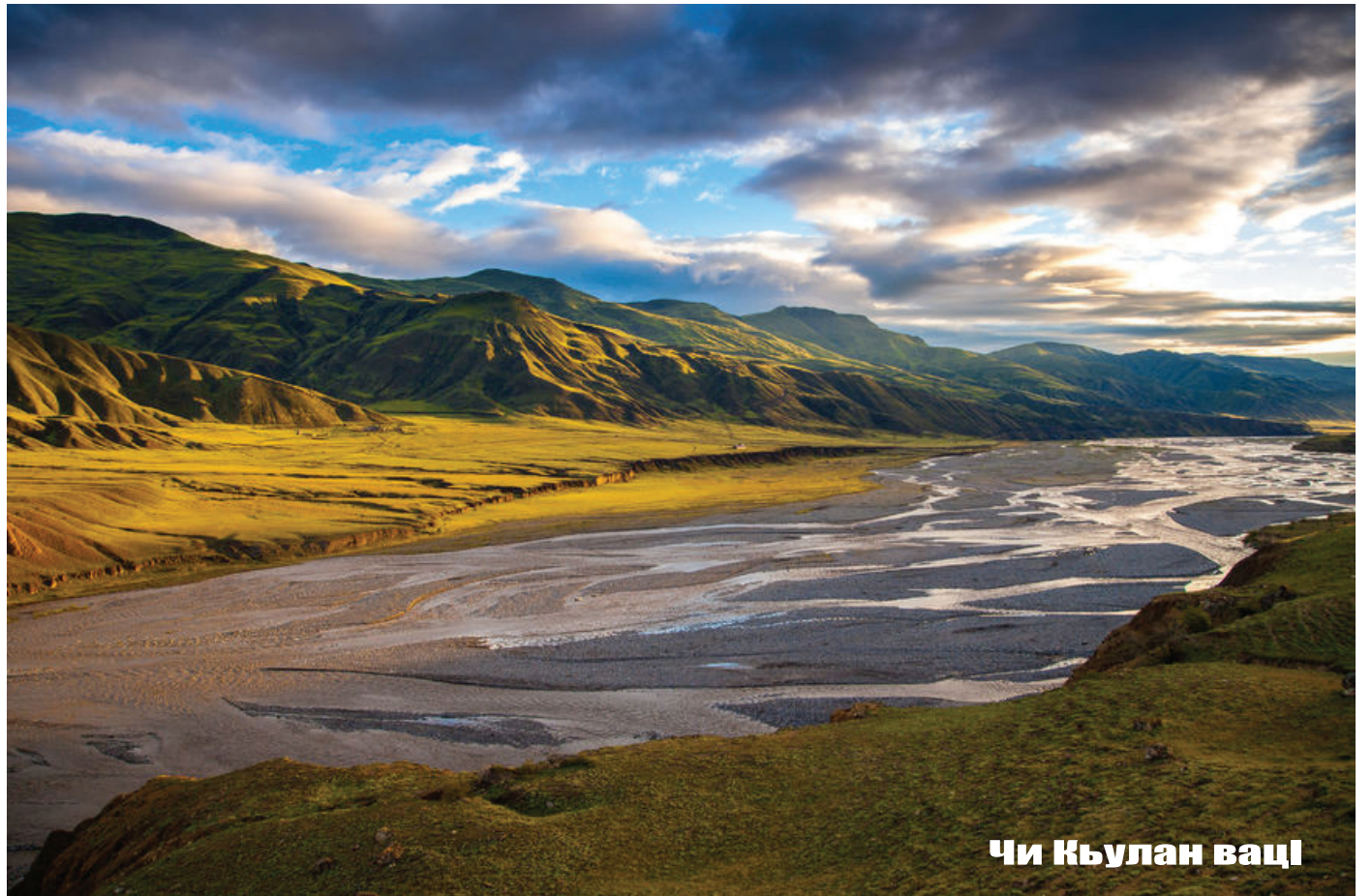
Чи Къулан вацл

В.Васильева лугъзвайвал, 2020-йисуз Магъачкъала-Дербент-Баку зарб фидай поезд кардик кутада. Агъалийри ихътин поезддин рехъ вилив хуьзва. Ракъун рекъин улакди къве республикадин арада фин-хтунар гзаф къезиларда. В.Васильева къейд авурвал, Дагъустандинни Азербайжандин алакъяр гзаф мукъва ва ихтибарлукъур я. И алакъяр генани вилик тухвана кланзава.