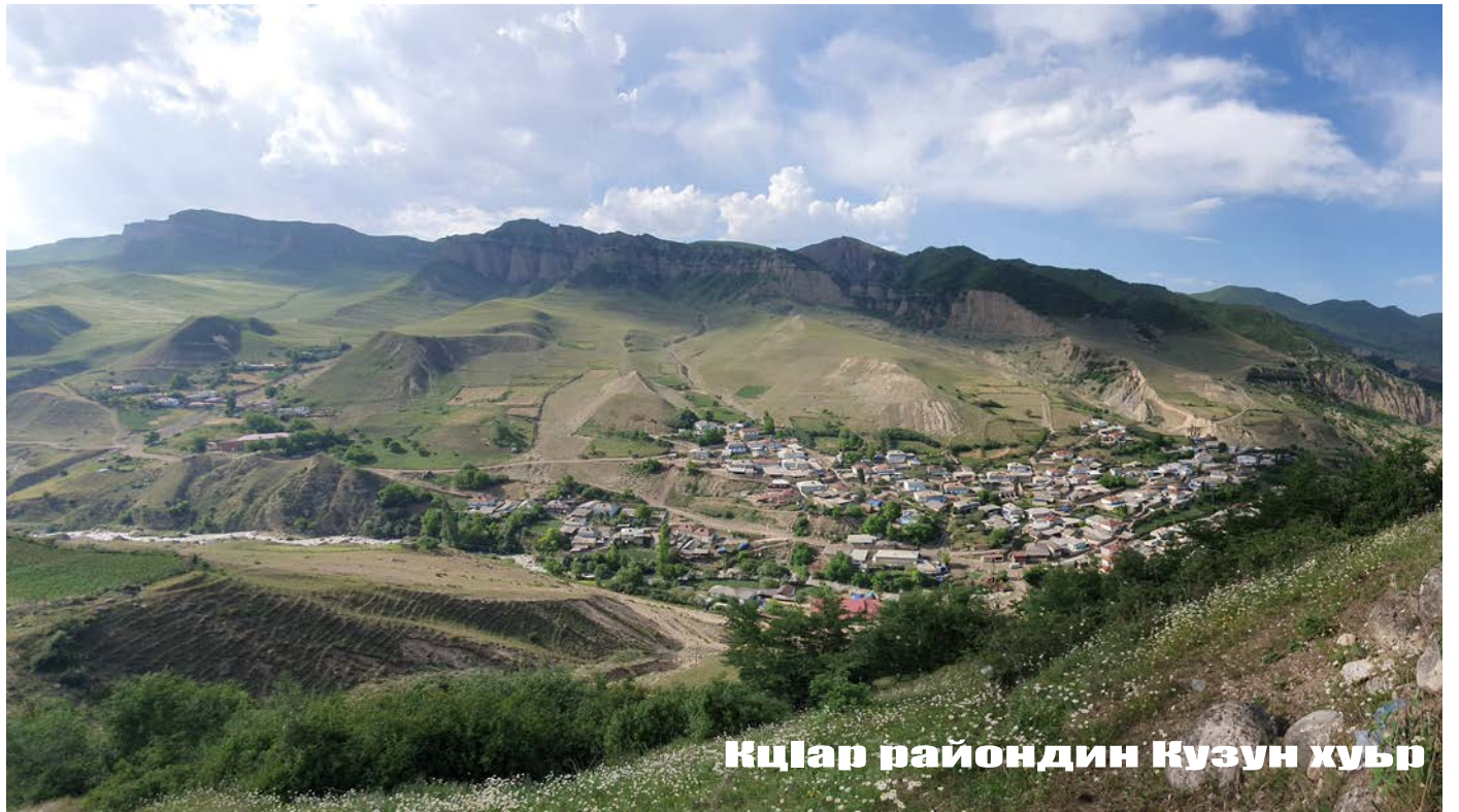
КӀлар райондин Кузун хуьр

Ктаб илимдин къвалах яз гъисабзавач, гъавилай ана менфят къачунвай чешмеярни илимдин къвалахра хас къайдада къалурнавач.