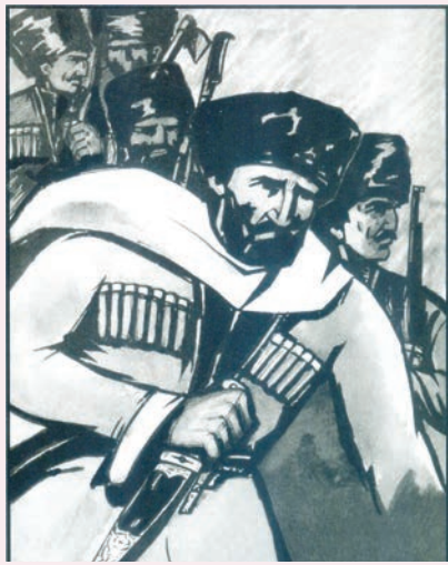
Ханбутай бег женгиниз физва. Худ.: Магъмуд Челебов

Генерал Гурьеваз яргунвидин чарчикай хуш атанач ва ада виликан йисара вичин аксина женг члугур Ханбутай бегдикай къиса къахчун къетлна. И карди вичихъ къалабулух кутур Ханбутай бегди Яргун, Эчехуьр, Цехуьл, Пигъиржал ва маса хуьрерин агъалийрихъ 3 агъзурдалай гзаф яракълу лезгийр клватлна. Ингъе и клеретдиз тупар гвай 5 агъзур урус аскердихъ галаз женг члугун регъят тушир. Урусин тупари датлана лезгийриз цай гузвай ва гъавилай женг тухун югъ-къандавай четин жезвай. Гъакл ятлани лезгийри аскеррал къегъалвилелди гъужумзавай.