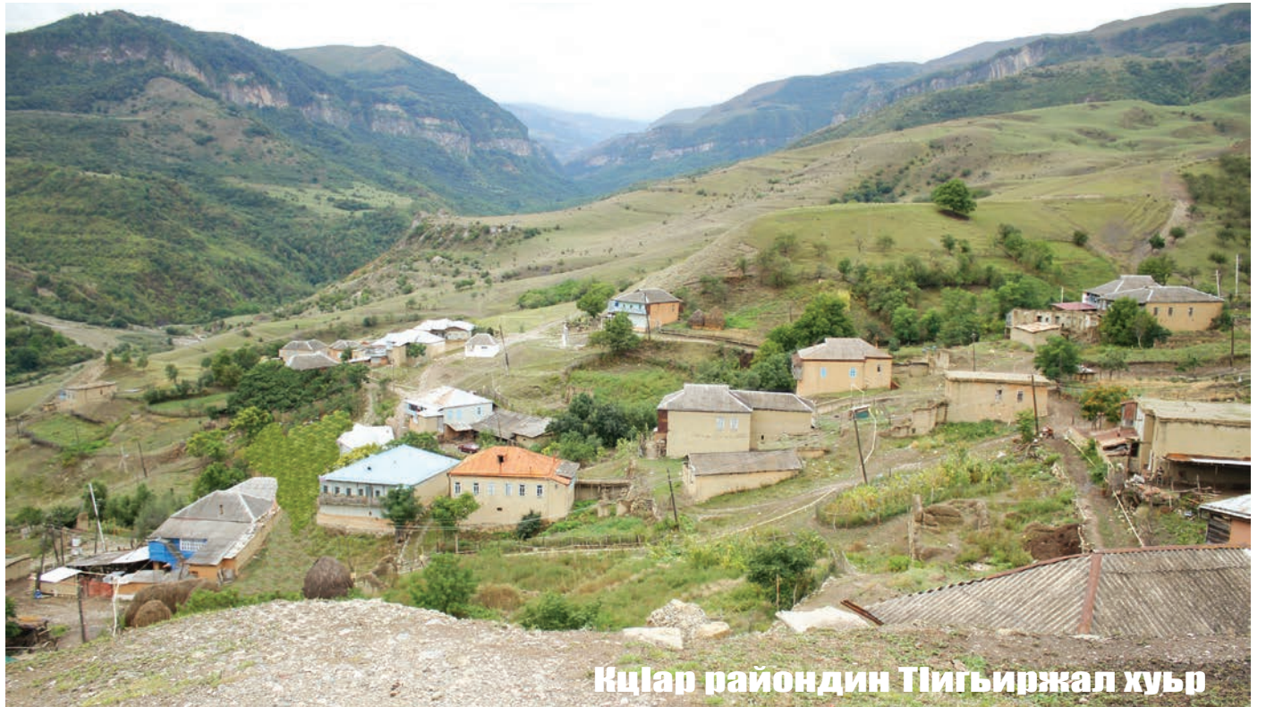
КцIар райондин Тигъиржал хуьр

И мукъвара Балакен районада май-вайрикай миже кхуддай цийи завод кардик кутада. Гъар йисуз 1,5 миллион литр миже гьасилна кIанзавай завод дуьньядин стандартрив къадай техникадивни аваданлухрив таъминарнава. Ина 80 цийи кIвалахдай чка ахъа жеда. Проектдив къадайвал, эцигунриз 16,1 миллион манат харжнава. Идалай гъейри карчивал вилик тухудай фондунуни карханадиз 7 миллион манат къетIен къезил шартIарин кредит ахъайнава.