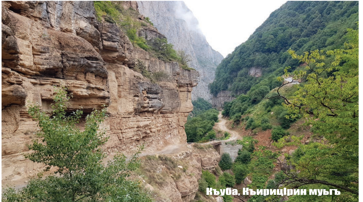
Къуба, Къирицирин муьгъ

Шуша эрменийрин пацукай хкатайдалай къулухъ шегъерда шумудни са мярекатар тухвана. Ина Баку эрмени-большевик чапхунчийрикай азад хъайи 103 лагъай йис къейд авуна. 27-сентябрдиз Шушада военный парад кыле фена. И парадди мад гъилера эрменийриз субутна хъи, Къарабагъ Азербайжандинди я ва и чилер чна гъамишалугъ вилин нинеяр хъиз хуьрвал я.