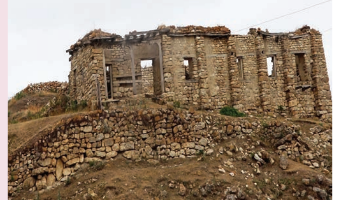
Abu Müslüm məscidinin qalıqları

Qeyd edək ki, Qrız dili Qafqaz dil ailəsinin ləzgi dil qrupuna aiddir. Buduğ dili ilə oxşarlığı olub genetik cəhətdən