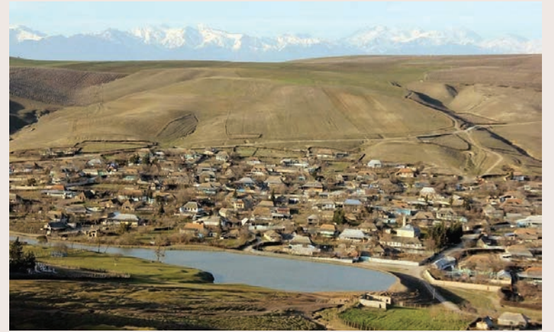
İsmayılı rayonunun Mollaisaq kəndi

Azərbaycandakı bütün haput kəndləri Quba qəzasındakı Haput kəndindən əmələ gəlib. XIX əsrdə dövrün ictimai-iqtisadi hadisələri nəticəsində bu kəndin əhalisi həm Quba qəzasının, həm də Göyçay və Şamaxı qəzalarının müxtəlif ərazilərinə köçərək məskunlaşmışdır. Həmin əsrin ortalarından başlayaraq haputların bir hissəsi indiki İsmayılı, Qəbələ və Ağdaş rayonlarının ərazilərinə köçərək orada Haput-Məlikli, Haputlu-Hideyli, Haputlu-Netes-Qacar, Haputlu Mollaisaq, Haputlu-Hacıhətəmli kəndlərini salmışlar. Bəzi mənbələrdə XIX əsrin ortalarında Göyçay qəzasında 736 haputlu ailəsinin məskunlaşdığını, Haputlu Məlikli, Haputlu Mollaisaq, Haputlu Gidəyli, Haputlu Nətəs Qacar, Haput-