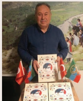
Туркия. Рамазан Кор

Алай вахтунда ктаб са шумуд къецепатан уьлкведиз ракъурнава. И кардихъ авсиятда чна са шумуд ши- кил чапзава.