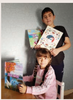
Англия. Шарвили Мутагирован веледар