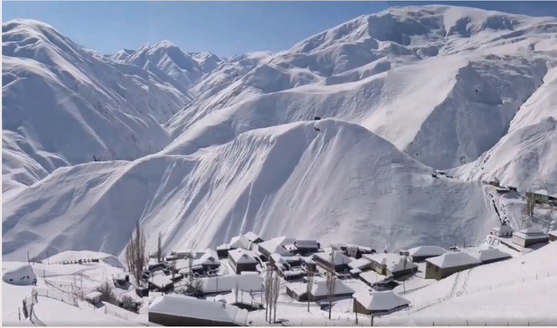
Quba rayonunun Haput kəndi

Qafqaz Albaniyasına daxil olan bəzi tayfalar qədim dövrlərdən Qafqaz sıra dağlarının yamacları boyu ərazilərdə məskunlaşmışlar. Onların arasında ləzgi dil qrupuna daxil olan etnoslar - ləzgilər, tabasaranlar, saxurlar, rutullar, ceklər, haputlar, qızlar, buduqlar, xınalıqlar, udinlər, ağullar da olmuşdur. Təsadüfi deyil ki, dillər muzeyi sayılan Qafqaz, o cümlə