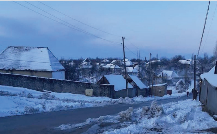
İsmayılı rayonunun Hacıhətəmli kəndi

Tanınmış dilçi alimlərdən N.Marr, N.Yakovlev, L.Jirkov və başqaları Şahdağ dil qrupunun bir neçə dildən ibarət olduğunu göstərmişlər. Kiçik Sovet Ensiklopediyasında Şahdağ xalqlarının ləzgilər, onların dilinin ləzgi dili olduğu göstərilir. İ.Qerber də XVIII əsrdə Şahdağ xalqlarının dilinin ləzgi dili olduğunu qeyd etmişdir. O, həmçinin onların bir qayda olaraq tatar (azərbaycan) dilini bildiklərini vurğulamışdır.