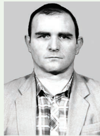
ДУСТ КИАНДА ЗАЗ

Жегьил чавуз пара жеда чахъ дустар, Амма дустар гзаф хьунни мумкин туш. Кевевайла, якьин жеда дуьз кьадар, Вуж ятла дуст халис чир хьун четин туш.