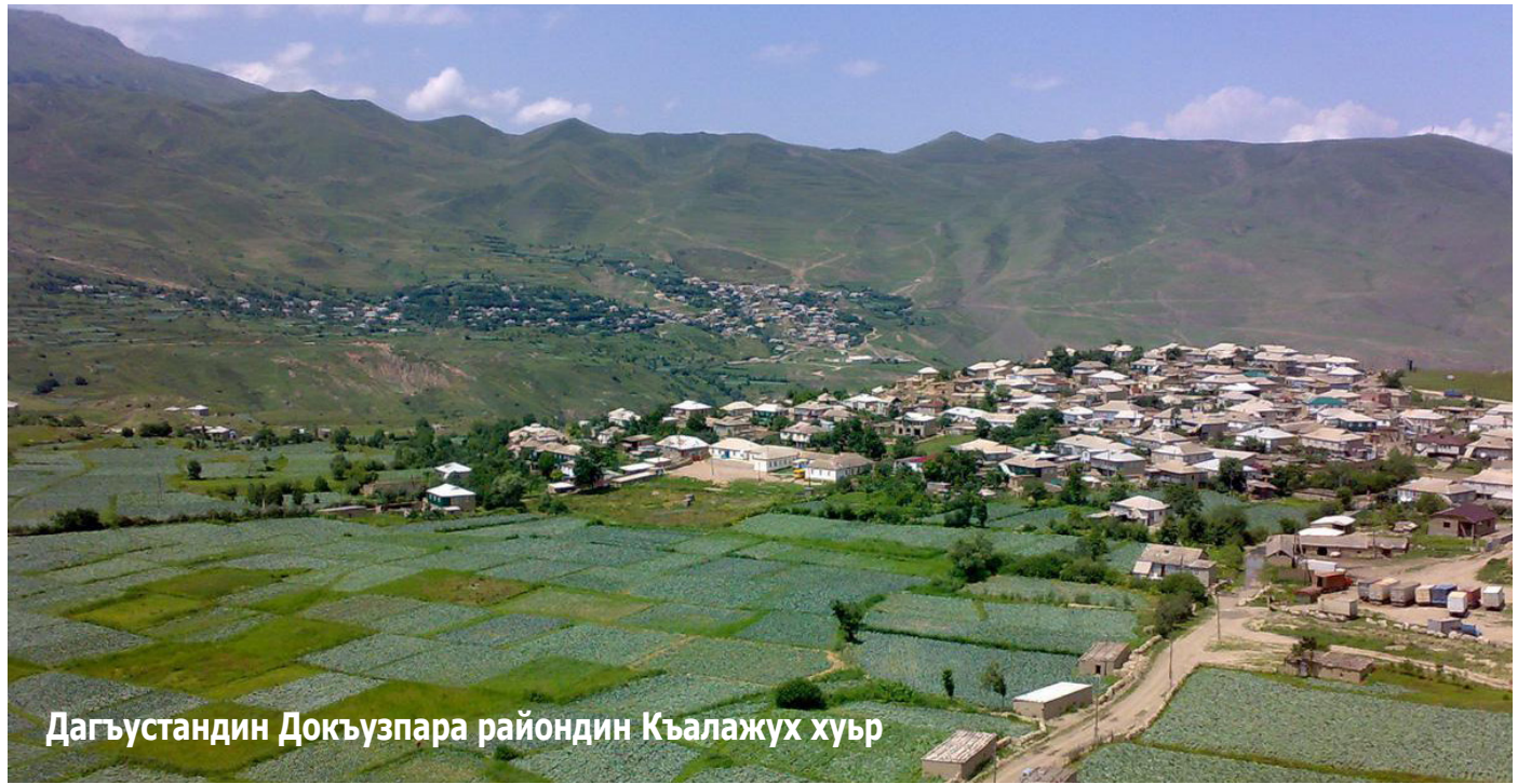
Дагъустандин Докъузпара райондин Къалажух хуьр

лугъуз гьикъван вахт я чиновникрихъ галаз женгина аваз. И члалар юкъван мектебра чирна кланзавай мажбури члаларин сиягъдик кутун патал чкадин халкъари датлана алахъунар ийизва.