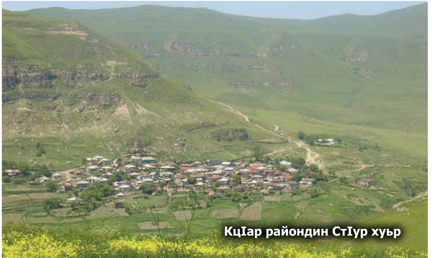
КцIар райондин СтIур хуьр