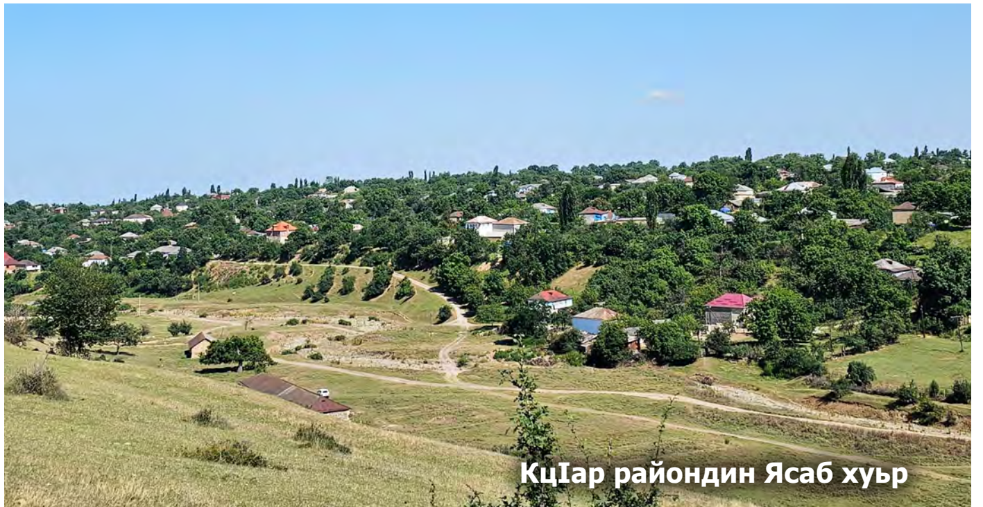
КцIар райондин Ясаб хуьр