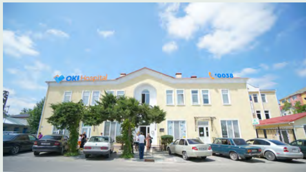
Qusar, OKİ Hospital