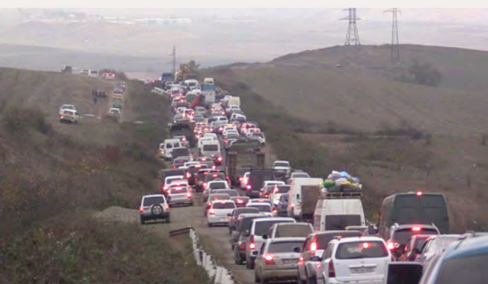
2023-йис. Эрменияр Ханкендидай акьатзава