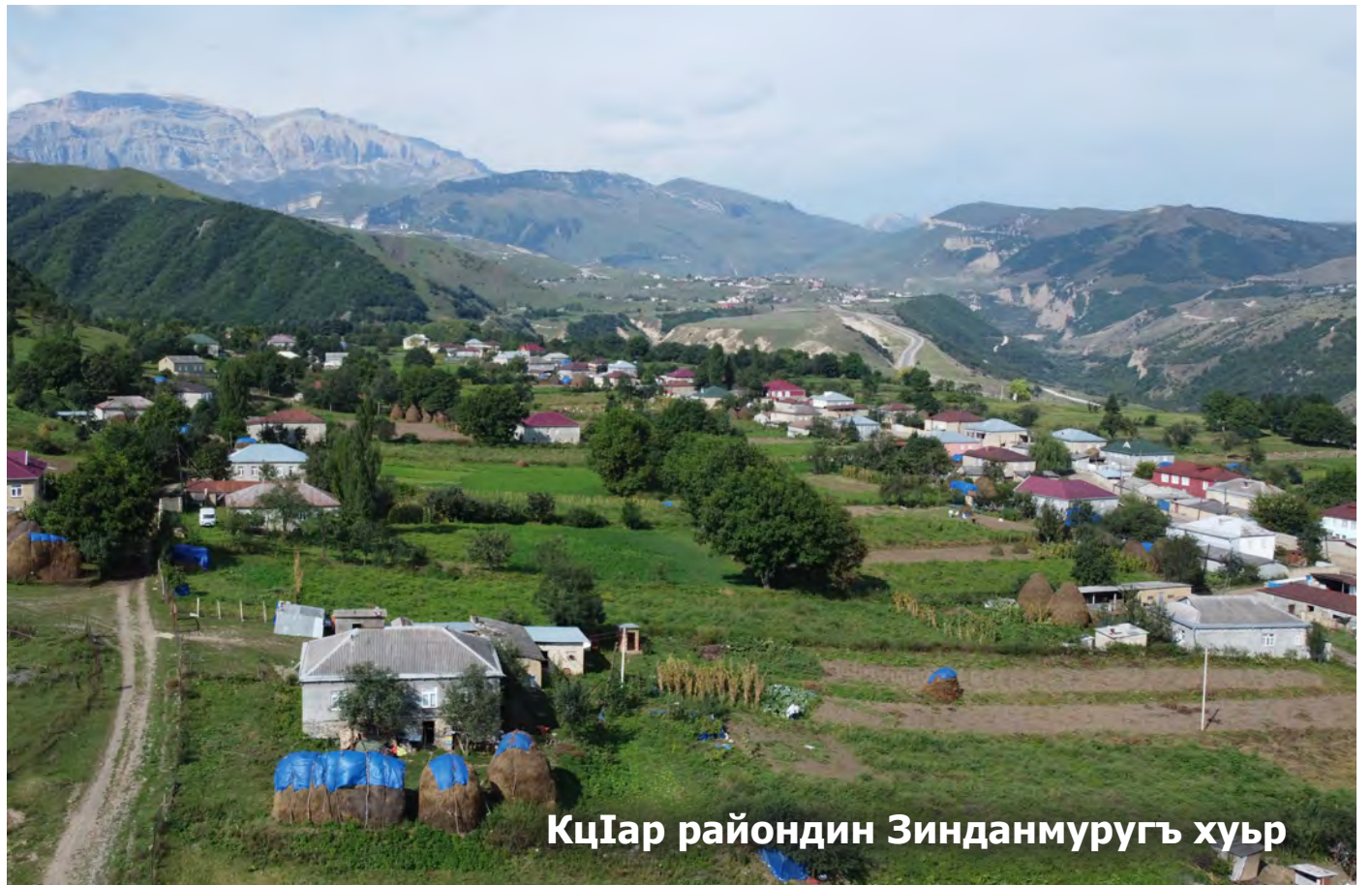
КцIар райондин Зинданмуругъ хуьр

360 аялди кIелун патал эцигнавай мектебда вири жуьредин къулайвилер арадиз гъанва. Вири кабинетар компютеррив ва маса аваданлухрив таъминарнава. Чехи спортдин зал, ктабхана, фу недай кIвал, ял ягъидай чкаяр аялрин ихтиярда вуганва. Ина лезги чIалан тарсарни гузва. Хъсандиз кIелуналди ва гъар йисуз институтрик экечIзавай жегъилрин къадардалди Къубадин маса мектебриз чешне къалурзавай Дигагъ хуьруьн мектебдихъ къилди цин гъамбархана ва трансформаторни ава.