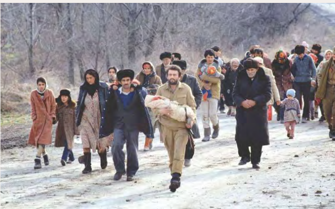
1992-йис. Азербайжанвияр Хожалыдай акьатзава