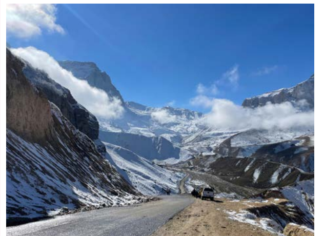
КцIарин Лацар хуьруьз физвай рехь