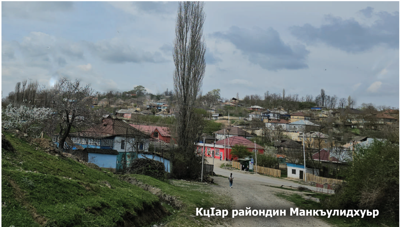
КцIар райондин Манкъулидхуьр

Телеканалдин кьилин макьсадрикай сад Россиядин агьалийриз Азербайжандин медениятдикайни тарихдикай малуматар гун я. Гунугар къве чалал – азербайжан ва урус чаларал гьазурда.