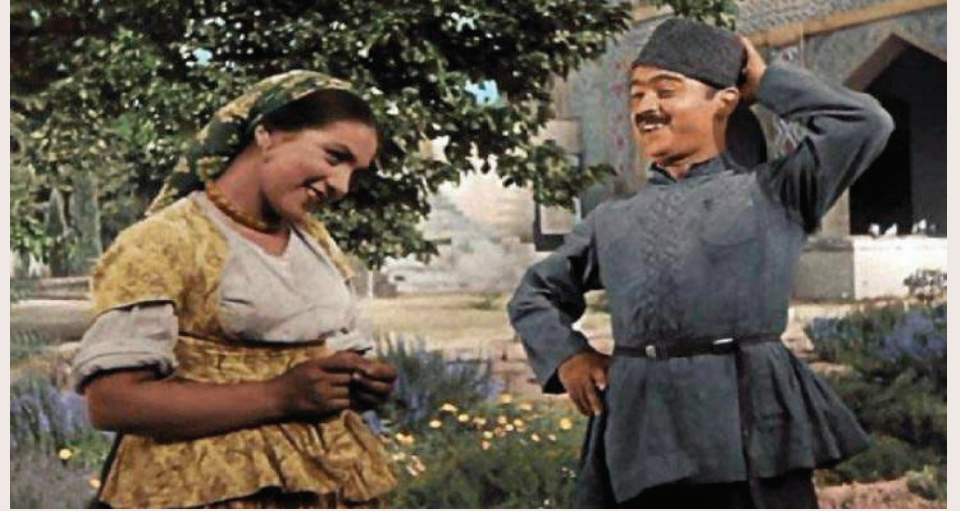
«Arşın mal alan» bədii filmindən səhnə

Xalq mahnılarının, muğam və təsniflərin, o cümlədən bəstəkar mahnılarının gözəl